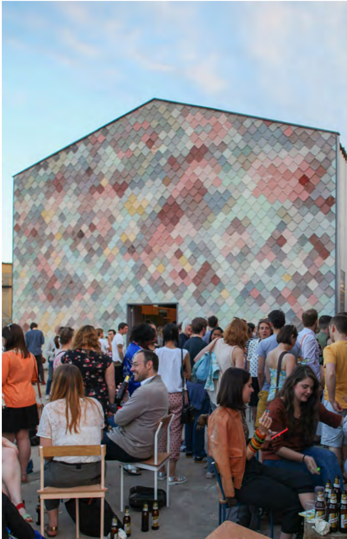
Assemble Yardhouse, London