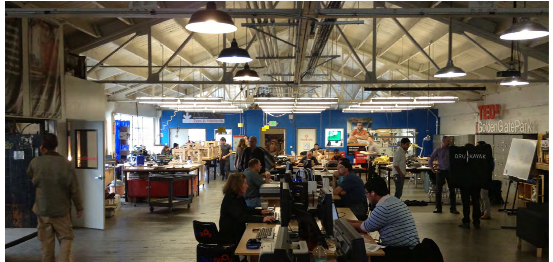
TechShop San Francisco